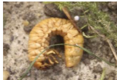
E ng e r l ing