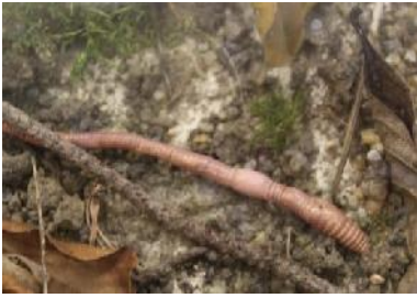
Re g en w u r m