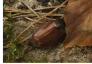
Ma i k a e f er