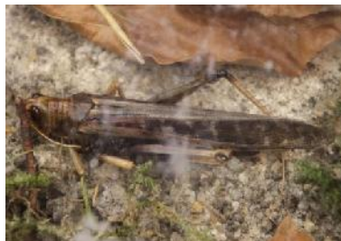
H e u s c h r e c k e