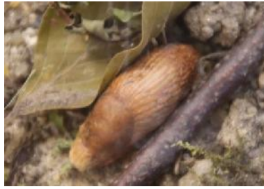
Na c ktsch n e c ke