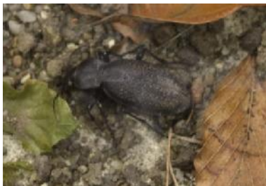
3 S chw a r z k a f e r

Die Waldtrappe stochern im Boden nach Insekten, Schnecken und Würmern. Besonders gerne frisst er die Tiere auf den folgenden Bildern. Kannst du sie benennen? Zur Hilfe sind schon alle Mitlaute da. Ergänze die fehlenden Buchstaben [a a a e e e e e e e e e e e e e e i i u u ä ä]