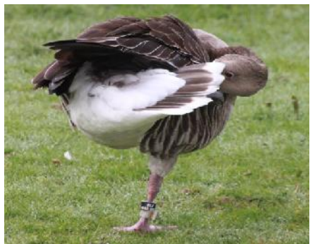
Sinclair, kleine Hexe