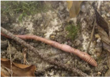
Re g en w u r m