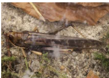
H e u s c h r e c k e