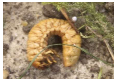
E n g e r l i n g