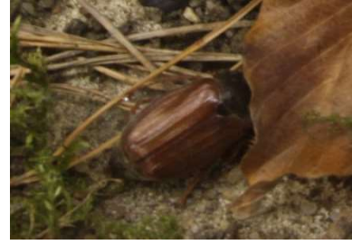
Ma i k a e f er