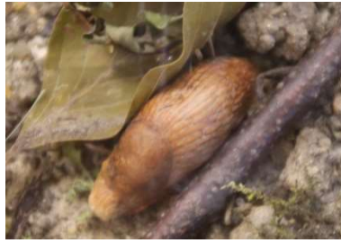
Na c ktsch n e c ke