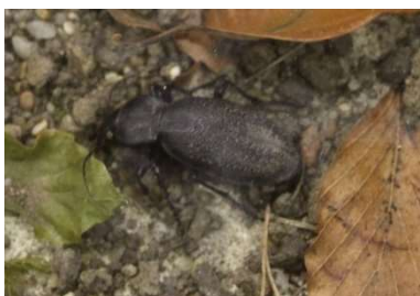
3 Schwarz kä f e r

Die Waldrappe stochern im Boden nach Insekten, Schnecken und Würmern. Besonders gerne frisst er die Tiere auf den folgenden Bildern. Kannst du sie benennen? Zur Hilfe sind schon alle Mitlaute da. Ergänze die fehlenden Buchstaben [a a a e e e e e e e e e e e e e e e i i u u ä ä]