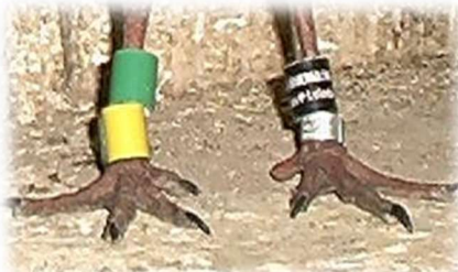
Nicht auf der Liste