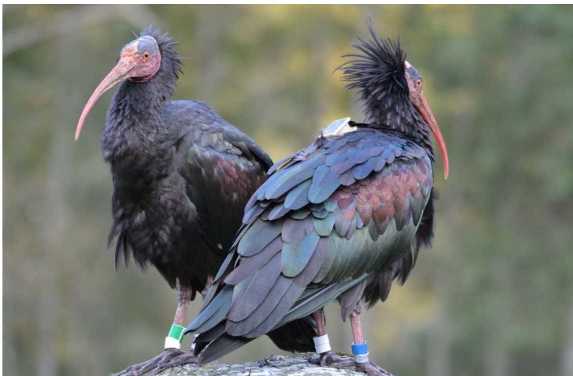
Othello + Aleppo → Jungtiere von 2016: Ash + Augustus